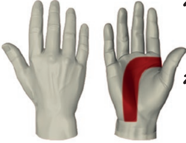
Takviye alanını belirtir.