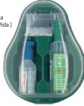
CPS024 - Göz Duşu İstasyonu (1Ad. ACQ425 + 1Ad. ACQ426 + 1Ad. Ayna)

Montaj Malzemeleri 1 Ad Duvar Panosu 1 Ad Pano Üzerine Monte Ayna 1 Set Montaj Malzemesi [ Dübel-Vida ]