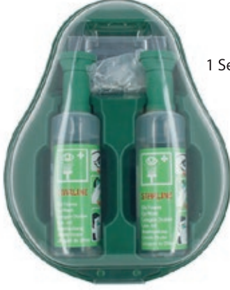
CPS023 - Göz Duşu İstasyonu (2Ad. ACQ425 + 1Ad. Ayna)

Grup halinde satılan iki adet göz duşu istasyon içeriklerimiz aşağıda belirtilmiştir.